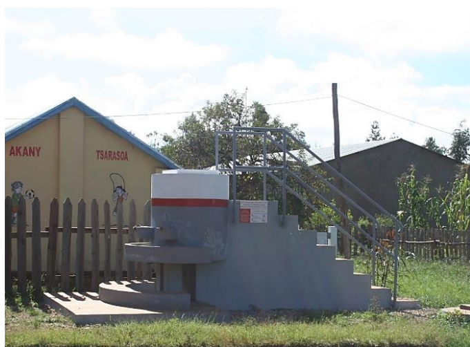
Dispositif de lavage des mains (puits, réserve d'eau et lave main) construit en 2019 par CODEGAZ & HOLCIM Madagascar.